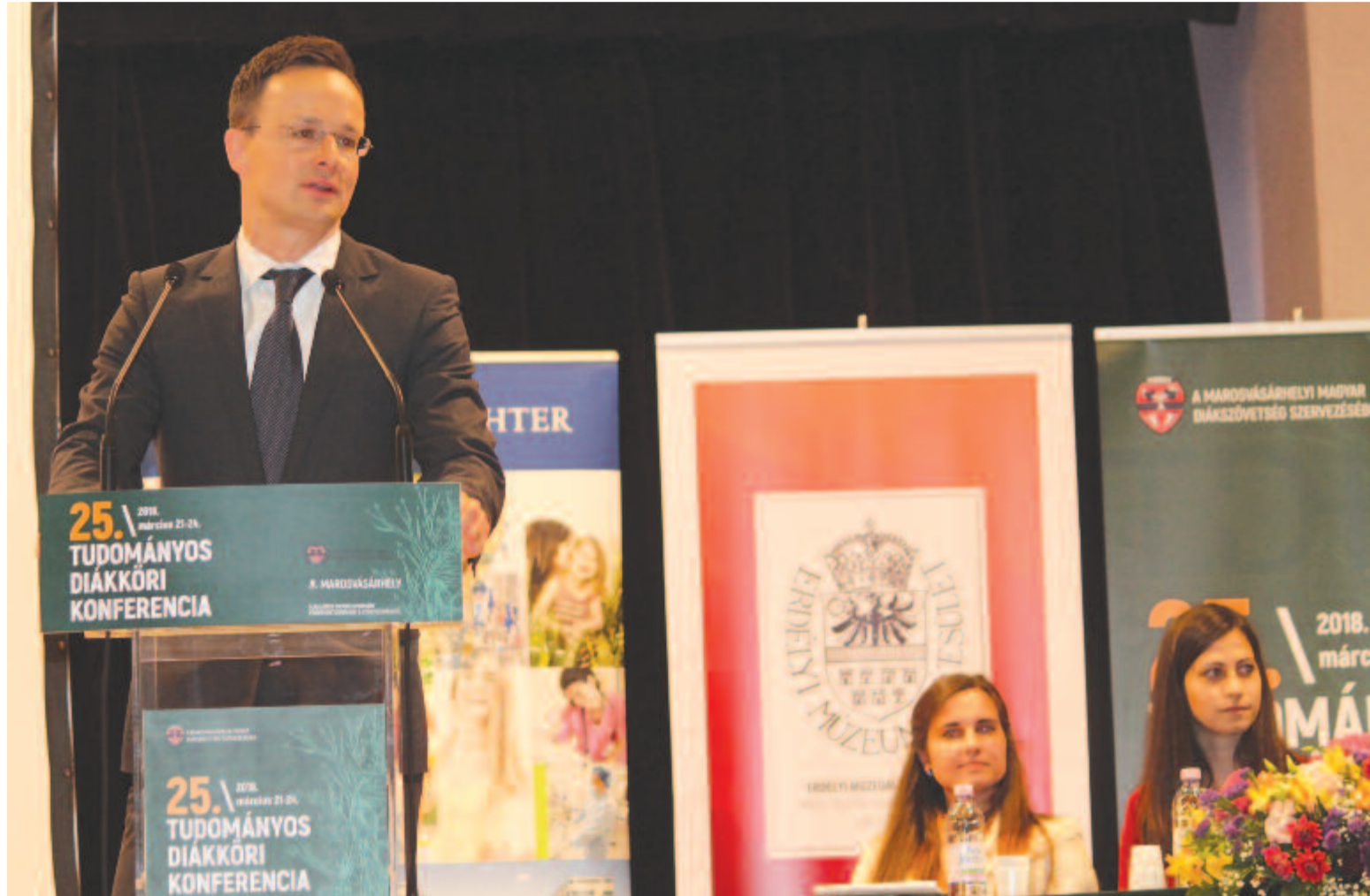
Szijjártó Péter a TDK megnyitóján